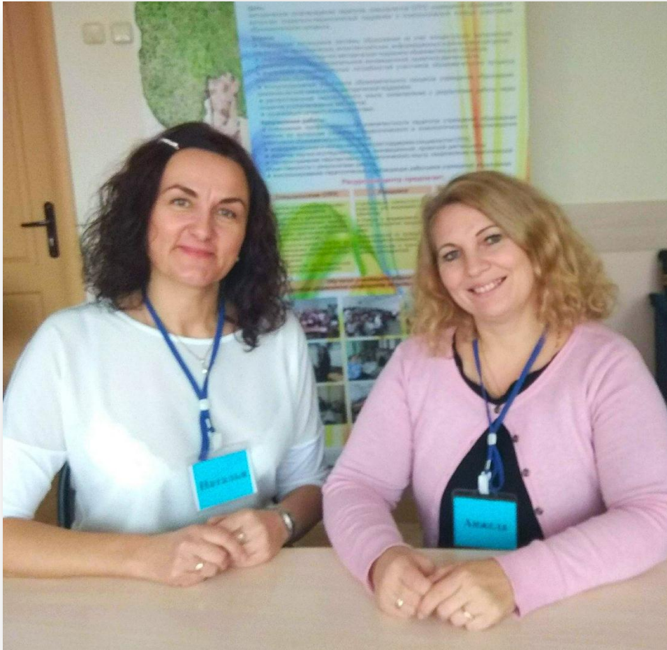
Фото 7 – Кураторы Школьной службы медиации