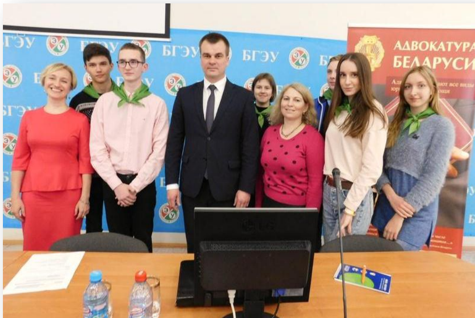
Фото 6 – Встреча с министром юстиции Республики Беларусь Слижевским О.Л.

беспристрастность медиатора, сотрудничество и конструктивный характер переговоров.