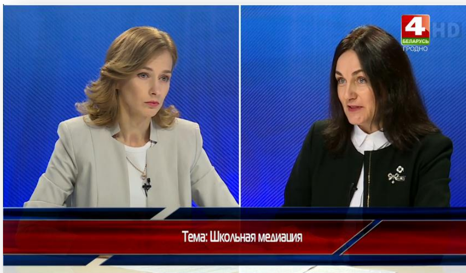
Фото 16 – Участие в передаче «Тема в деталях»