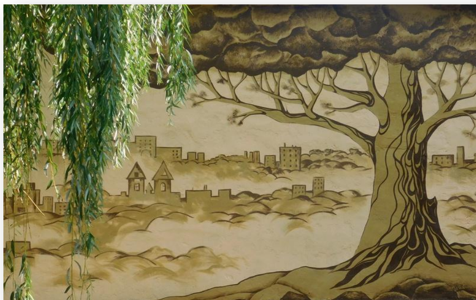
Фото 4 – Дворик юных медиаторов

конфликтологической компетентности определяется знаниями, личностными качествами человека, его опытом и навыками конструктивного разрешения конфликтов (А.Я. Анцупов, А.И. Шипилов, Н.В. Гришина, Б.И. Хасан) [4].