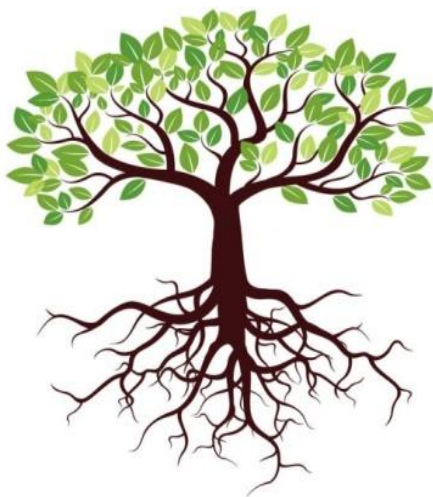
Рис.1 Дерево конфликта

У дерева есть видимая для всех часть (ветви, ствол) и невидимая (корни). Видимая часть дерева – это позиции сторон (то, что участники конфликта заявляют, о чем говорят или делают (обвинения, ругательство, крики, драка и т.д.)). Невидимая часть – это реальная причина конфликта (потребности, интересы и страхи сторон).