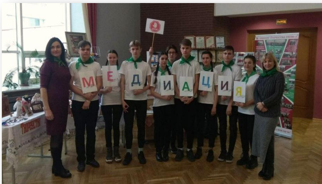
Фото 14 – Участие команды в конкурсе на лучший проект шестого школьного дня: Фест «6-ой элемент»

Кроме того, наши ребята активно популяризируют школьную медиацию среди учащихся других школ нашего города (Фото 14), а также с огромной радостью встречаются с юными медиаторами из других городов (Фото 15).