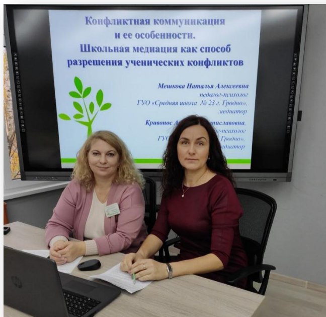
Фото 18 – Выступление на психолого-педагогических чтениях