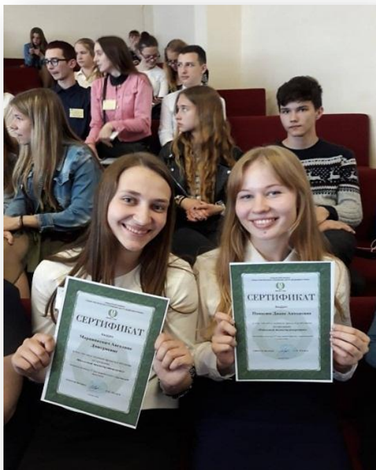
Фото 9 – Вручение сертификатов школьным медиаторам

Обучение новых групп медиаторов проводится на регулярной основе, опытные учащиеся-медиаторы выступают в роли тренеров-ассистентов по принципу «равный обучает равного». По итогам обучения вручаются сертификаты (Фото 9).