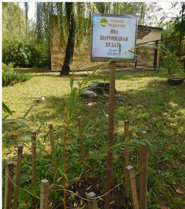
Фото 5 – Символ школьной медиации