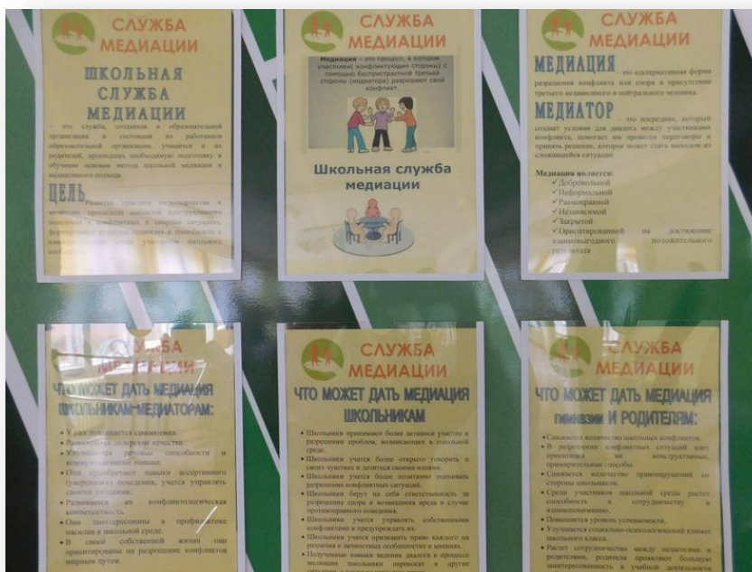
Фото 3 – Стенд Школьной службы медиации

Медиация является: добровольной, неформальной, равноправной, независимой, конфиденциальной, ориентированной на достижение взаимовыгодного положительного решения.