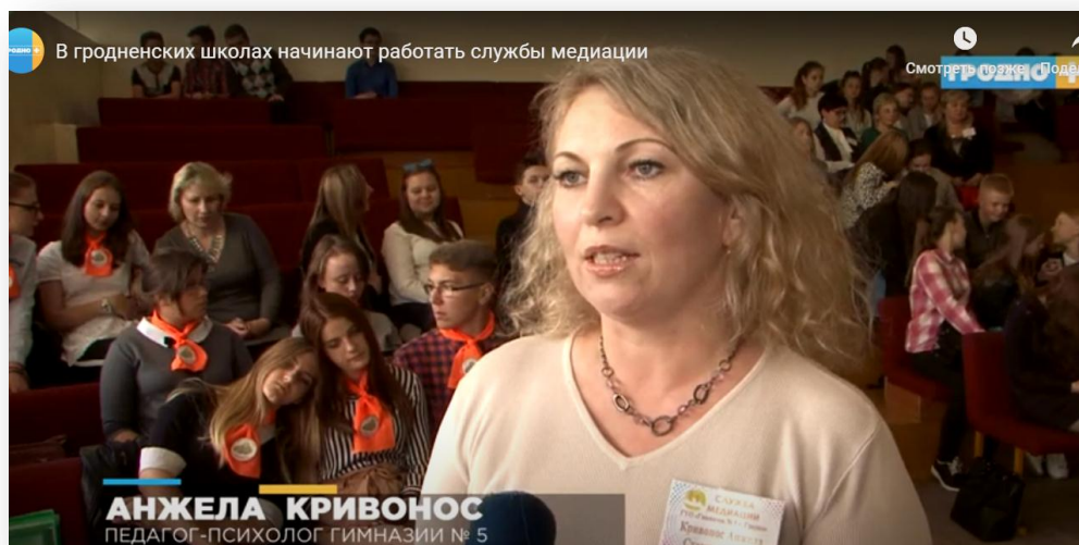
Фото 17 – Интервью для телеканала Гродно +