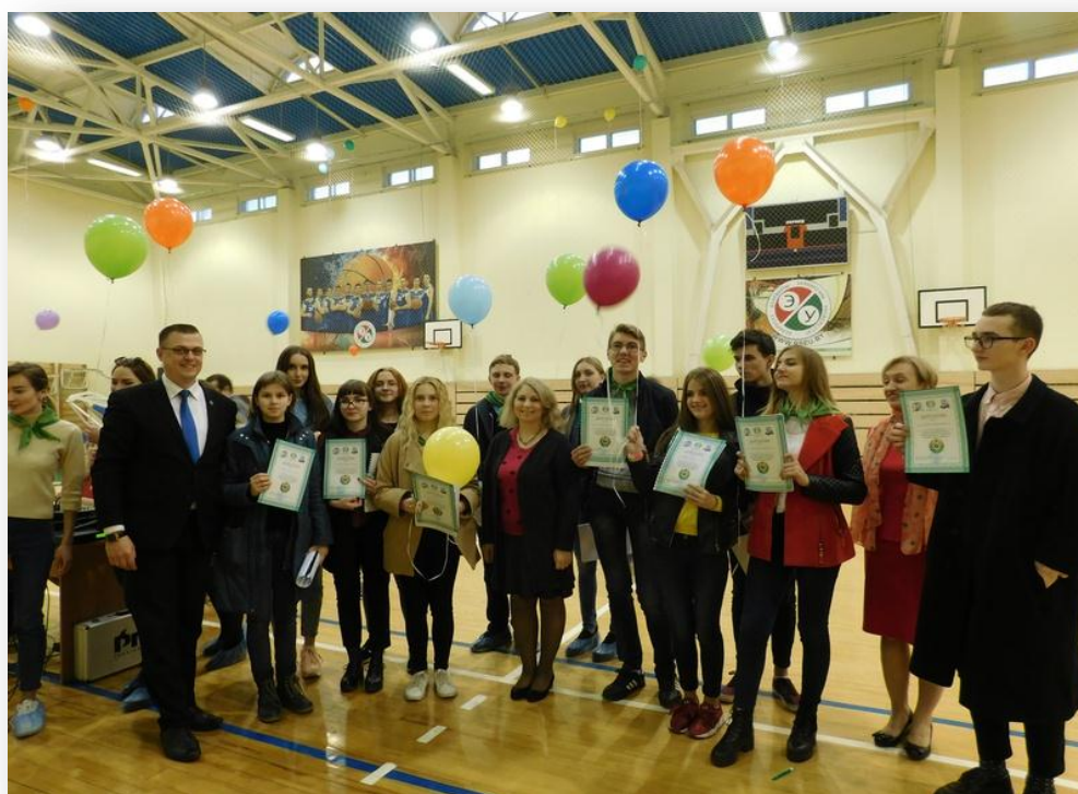
Фото 15 – Фестиваль «Медиация будущего», г.Минск, 25.04.2018