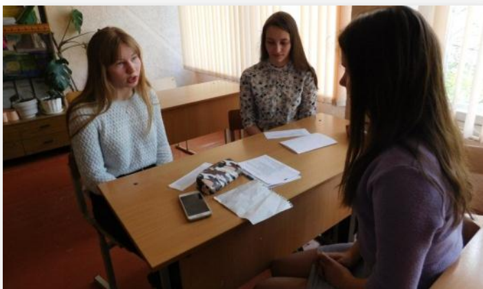
Фото 8 - Учебные медиации

Проводилась отработка практических навыков, кейсов (учебных медиаций) и супервизия со стороны кураторов (Фото 8).